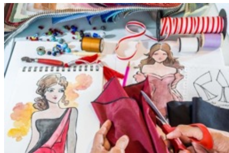
«ХУДОЖНИК ПО КОСТЮМУ»