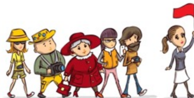
«ПОМОЩНИК ЭКСПУРСОВОДА (ГИДА)»